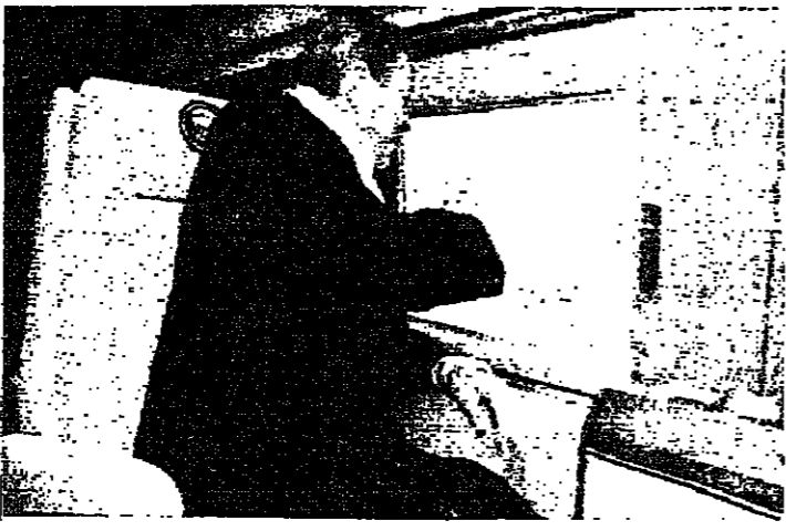
يحيى المودين من نافذة الطائرة